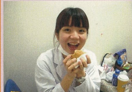
ランチタイムです♡