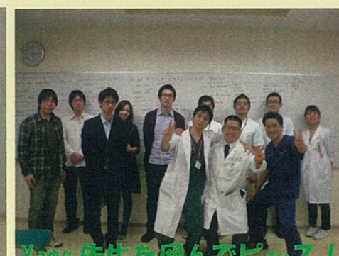
Yang先生を囲んでピース！