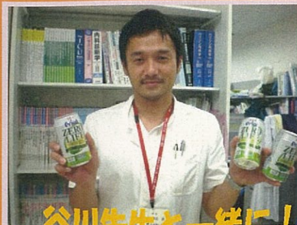
谷川先生と一緒に！